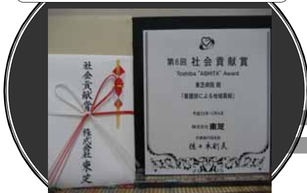
社会貢献賞(Toshiba“ASHITA”Award)は、社会貢献活動のさらなる活性化をはかるために制定され、顕著な成果を挙げた活動に対してコーポレート社長表彰を授与しています。

人と、地球の、明日のために。東芝グループ 東芝グループは「地球内企業」として世界各地で社会貢献活動を推進しています。