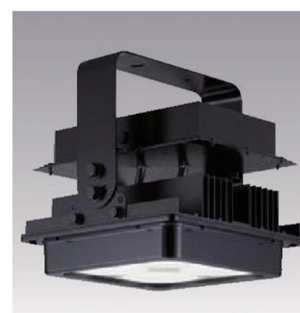
400Wメタルハライドランプ 器具相当