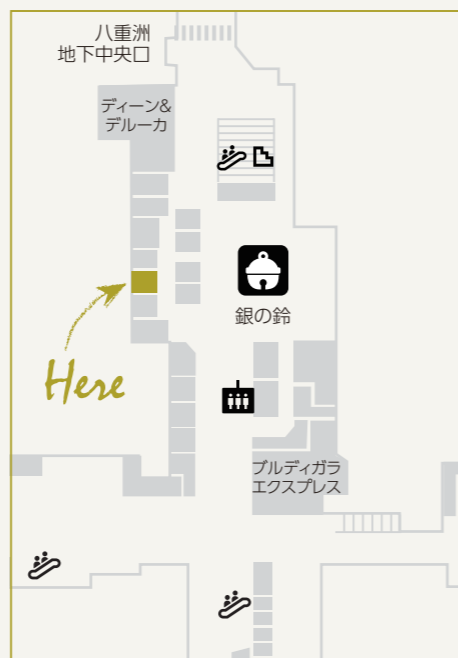
富士見堂 東京駅グランスタ店 東京駅B1F グランスタ東京 (改札内なので乗車券・入場券が必要なエリアです)

東京オリンピック・パラリンピック2020の開幕まで1年を切りました。オリンピック開会式のちょうど1年前となる7月24日には東京国際フォーラムでイベントが行われました。ニュースで報道されているのをご覧になられた方もいらっしゃるかもしれませんね。東京駅にも、丸の内中央広場にカウントダウンクロックが設置され、連日記念写真を撮る方々にぎわっています。この時計は高さ約4m、幅約3.2mで日の丸をイメージしたデザインになっています。東京オリンピックの開会式は2020年7月24日(金)、閉会式は8月9日(日)、パラリンピックの開会式は8月25日(火)、閉会式は9月6日(日)です。来年の今頃は連日の熱戦にぎ付きとなっていることでしょう。今から楽しみですね!