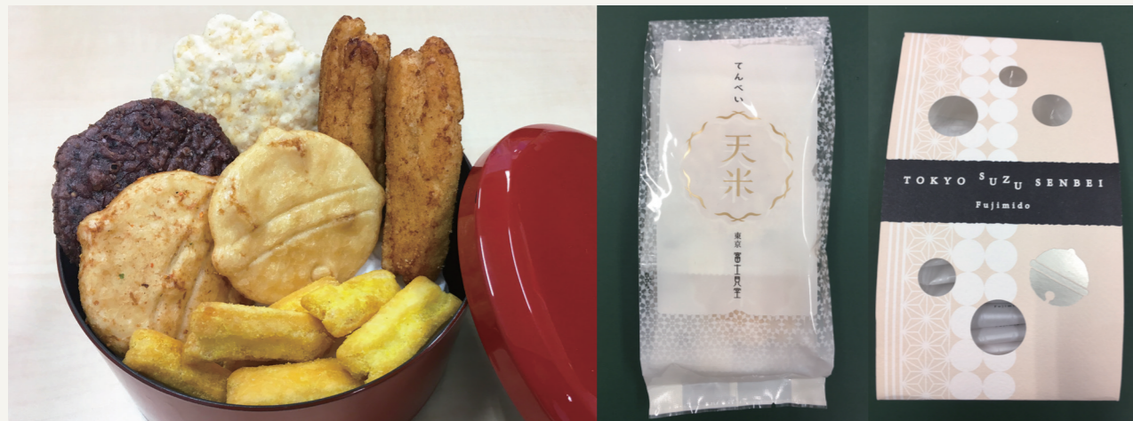
天米(てんべい)、まくらぎ 581円(税込)、もろこしあられ 420円(税込)、東京鈴せんべい 天米(てんべい)10枚入り 648円(税込) 東京鈴せんべい12枚入り 864円(税込)

朝から厳しい暑さが続いている毎日、体調管理が難しいと感じていらっしゃる方も多いのではないのでしょうか。エアコンを上手に使うことで熱中症を防ぎながら、体を冷やしすぎたりしないよう、また、十分な睡眠をとれるよう工夫して過ごしたいですね。