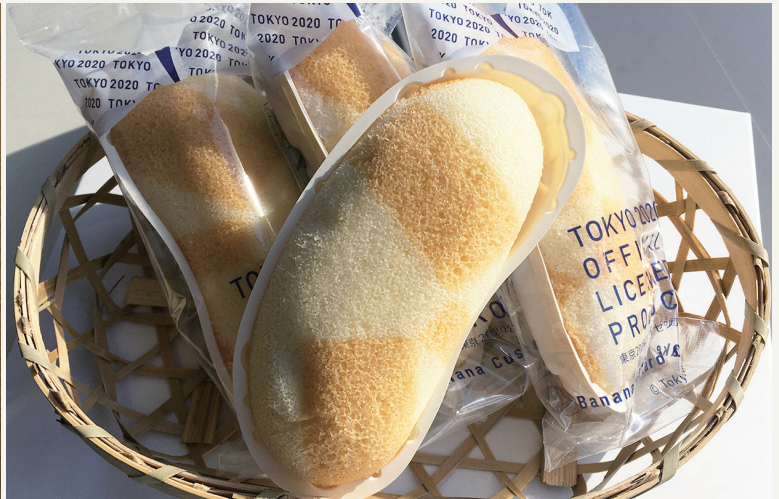
東京ばな奈「東京2020オリンピックエンブレムバナナカスタードケーキ」 8個入り1,134円(税込)

おススメするのは、もはや東京土産の定番ともいえる「東京ばな奈」。何を今さら、と思われるかもしれませんが、東京ばな奈は季節によっても限定品が出ますし、都内でも観光地によって異なるフレーバーがあるなど、見た目も味も常に進化しているので、いつ買っても楽しめて、お土産として渡してもとても喜ばれるものの1つだと思います。